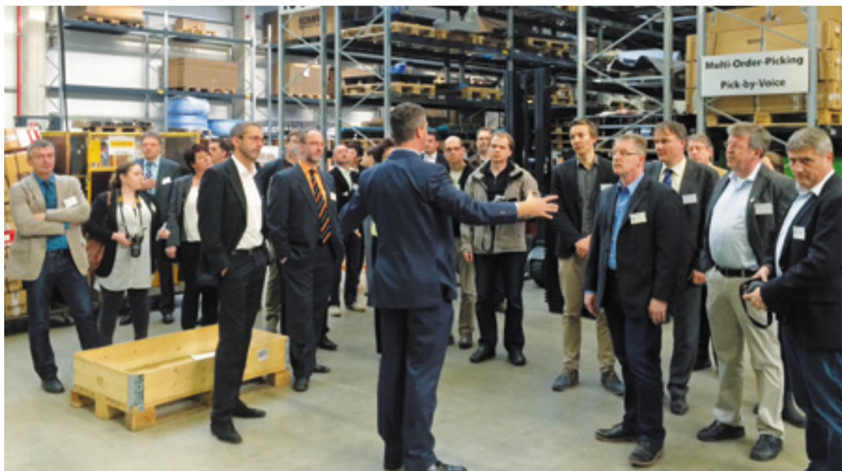
In zwei Gruppen wurden die Teilnehmer des Unternehmertreffens durch das Logistikzentrum geführt.

Unternehmertreffen bei Ehrhardt + Partner in Boppard