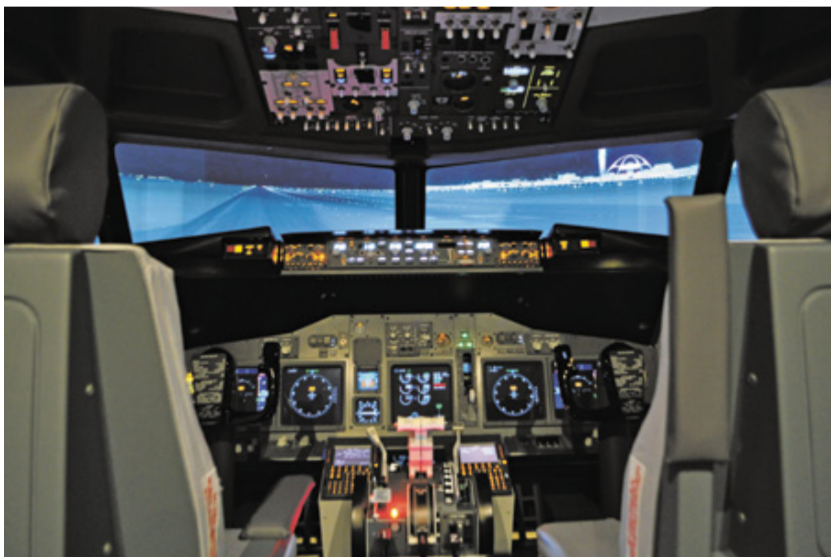
Selbst der Pilot sein – die von drei Beamern erzeugte 180-Grad-Aussicht ist täuschend echt.

Ready for Take-off! – Per Flugsimulator von Kastellaun abheben!