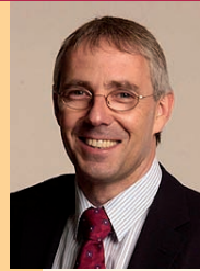
Hendrik Hering Minister für Wirtschaft, Verkehr, Landwirtschaft und Weinbau des Landes Rheinland-Pfalz

Ich würde mich freuen, zahlreiche Vertreter der rheinland-pfälzischen Wirtschaft mit den nachfolgenden Maßnahmen unterstützen zu können und wünsche Ihnen „grenzenlosen“ Erfolg.